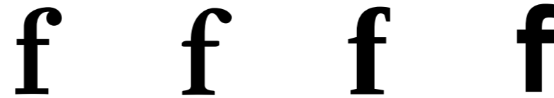
Botónou bola Lágrima ou gota Bico ou afiado Sen terminal