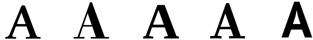
Mistiforme Filiforme Rectiforme Cuadrangular Sen serifa